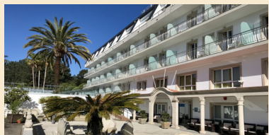
HOTEL MERCURE 4*