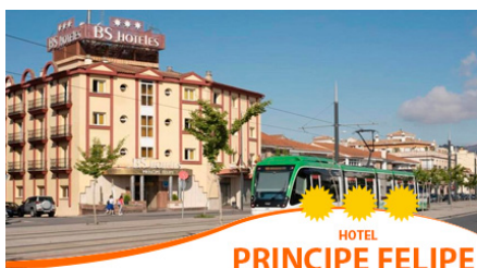
HOTEL PRINCIPE FELIPE