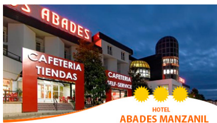
HOTEL ABADES MANZANIL